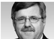
Eduard Gnesa Ambassadeur extraordinaire chargé de la collaboration internationale en matière de migrations, Direction du développement et de la coopération DDC, Berne

La mondialisation va de pair avec une intensification des mouvements migratoires internationaux. Selon les estimations de l'Organisation internationale pour les migrations (OIM), notre planète comptait environ 214 millions de migrants internationaux en 2010. Quelque 3% de la population mondiale vivent pendant plus d'un an hors de leur pays d'origine. Par ailleurs, il faut savoir que le monde compte environ 47 millions de réfugiés et de personnes déplacées. L'Europe abrite environ 70 millions de migrants, soit 33% des effectifs recensés dans le monde. Dans ce contexte, la question d'une gestion efficace des flux migratoires se pose avec une acuité croissante pour les États. L'un des principaux défis à relever est de créer les conditions nécessaires pour que les migrations aient lieu de manière sûre, régulière et dans le respect des droits et des intérêts de toutes les parties concernées. Il faut tenir compte à cet égard du rôle que peuvent jouer les migrants en termes de développement.