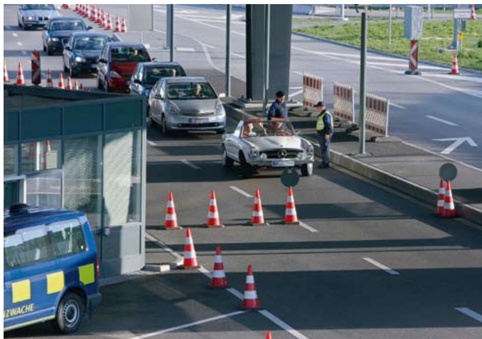
L'intégration des immigrés sur le marché du travail en Suisse fonctionne plutôt bien comparée à d'autres pays de l'OCDE. Si l'on compare les taux d'emploi et de chômage des personnes nées respectivement dans le pays et à l'étranger, la Suisse se situe au-dessus de la moyenne pour le premier et en-dessous pour le second. Ces bons résultats tiennent au fait que la grande majorité des immigrés sont originaires de l'EEE. En photo : la douane de Rheinfelden.

Jusqu'à une date récente, la question de l'intégration des immigrés ne faisait pas partie des préoccupations majeures des autorités suisses. Tant que les migrations pour raison de travail prédominaient, accompagnées pour certaines d'entre elles d'arrivées plus ou moins différées de flux liés au regroupement familial, la question de l'intégration des immigrés et de leurs enfants sur le marché du travail était un enjeu moins important que l'impact macroéconomique sur les salaires et les changements structurels 3 . Au cours des vingt dernières années, cependant, les flux se sont diversifiés, notamment par le biais des migrations à caractère humanitaire venant de pays plus lointains, et de l'ex-Yougoslavie. La diversification des flux migratoires, les entrées pour des motifs autres que le travail, le ralentissement de la croissance économique sont autant de raisons qui expliquent pourquoi la question de l'intégration des immigrés a gagné en importance dans le débat public, au point que les autorités suisses ont décidé de donner une nouvelle dimension à la politique d'intégration.