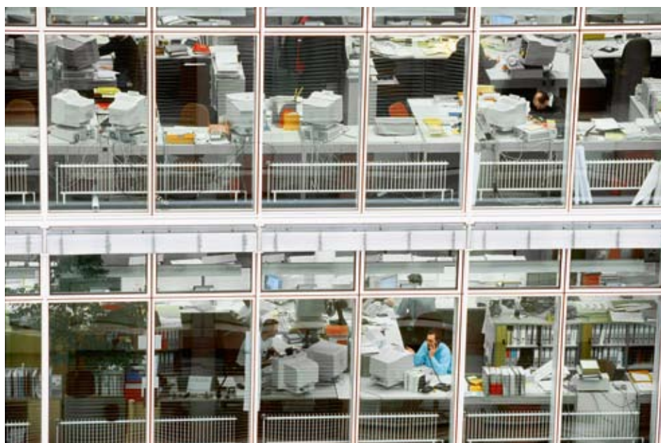
La statistique de l'emploi se fonde sur un échantillon de 62 000 établissements des secteurs secondaire et tertiaire. Son but est la production d'indicateurs conjoncturels décrivant l'évolution de l'emploi en Suisse.