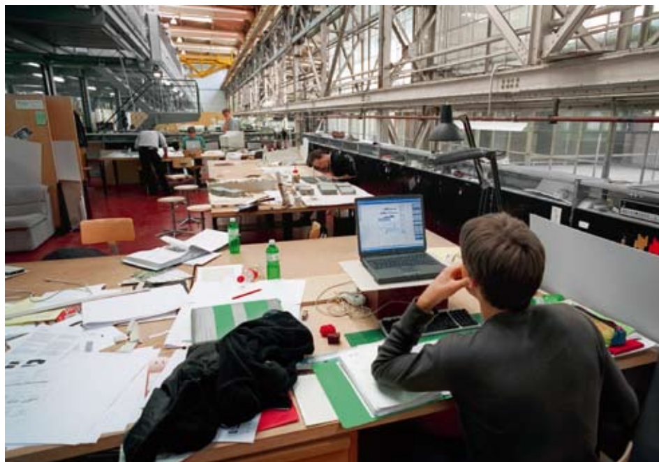
L'assurance de la qualité en tant que telle incombe aux hautes écoles exclusivement. La Confédération et les cantons leur délivrent une accréditation suivant la LAHE, en veillant à ce que ce chapitre fasse l'objet d'un traitement efficace suivant des critères communs.