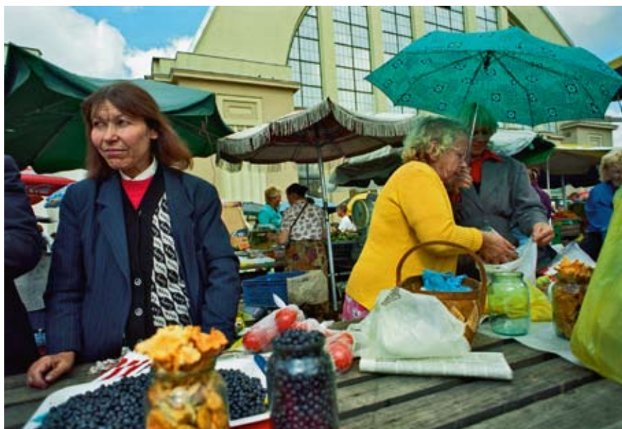
La quasi-totalité des pays qui ont jusqu'ici recouru au FMI pour une aide d'urgence se situent en Europe centrale et orientale ainsi qu'en Asie centrale. En illustration: marché en Lettonie.