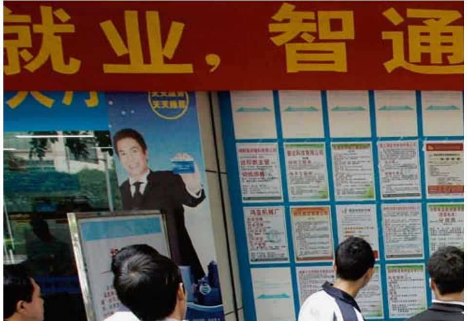
Dans les années qui ont précédé la crise, de nombreux pays émergents et en développement ont mené une politique monétaire et budgétaire prudente. Bien ou mal positionnés, tous sont pourtant touchés par la crise. En illustration: scène de chômage en Chine.