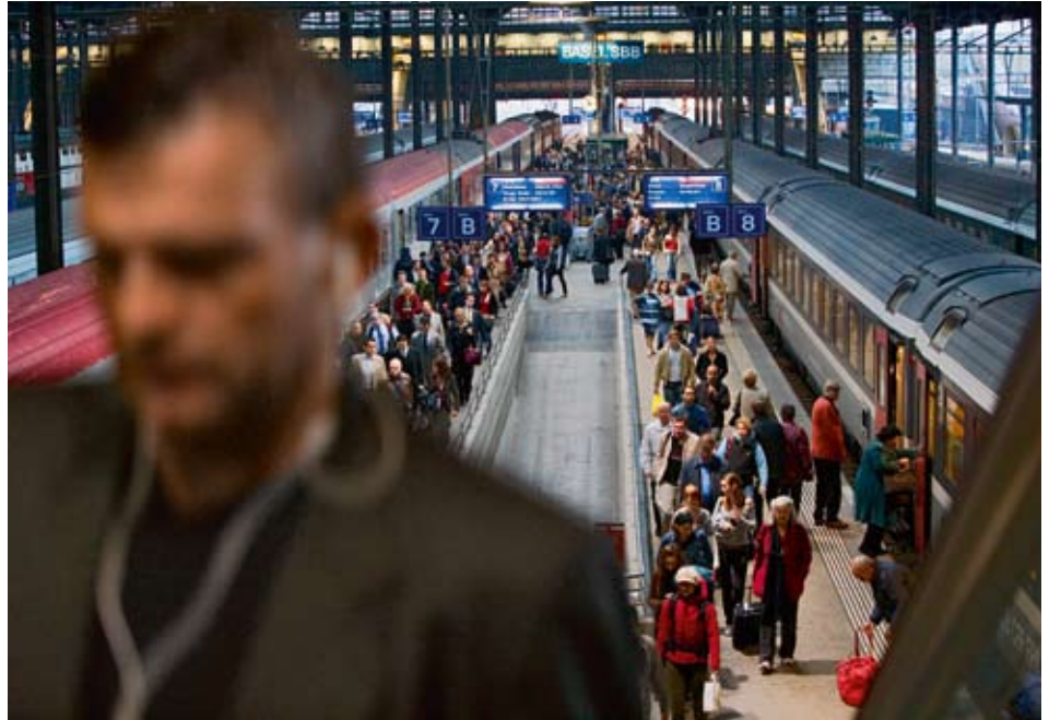
Des flux de pendulaires dans les agglomérations aux heures de pointe, un trafic touristique le week-end, une suite ininterrompue de trains de marchandises sur l'axe nord-sud du mardi au jeudi, et un vide béant le dimanche sont des images familières. La différenciation par les prix peut se révéler un élément de gestion dans ces cas.

Les infrastructures des transports sont sans conteste l'épine dorsale d'une économie nationale et conditionnent son développement. Sans elles, il n'est pas possible de répartir géographiquement le travail. L'aménagement et l'utilisation d'infrastructures posent par conséquent des questions économiques fondamentales: comment dimensionner les infrastructures des transports? comment les financer? quelles règles faut-il adopter pour gérer l'accès aux réseaux de transports et rationaliser leur utilisation? Le monde politique devrait se demander s'il ne faut pas subordonner l'organisation de l'accès au réseau au seul objectif d'une utilisation efficace de l'infrastructure.