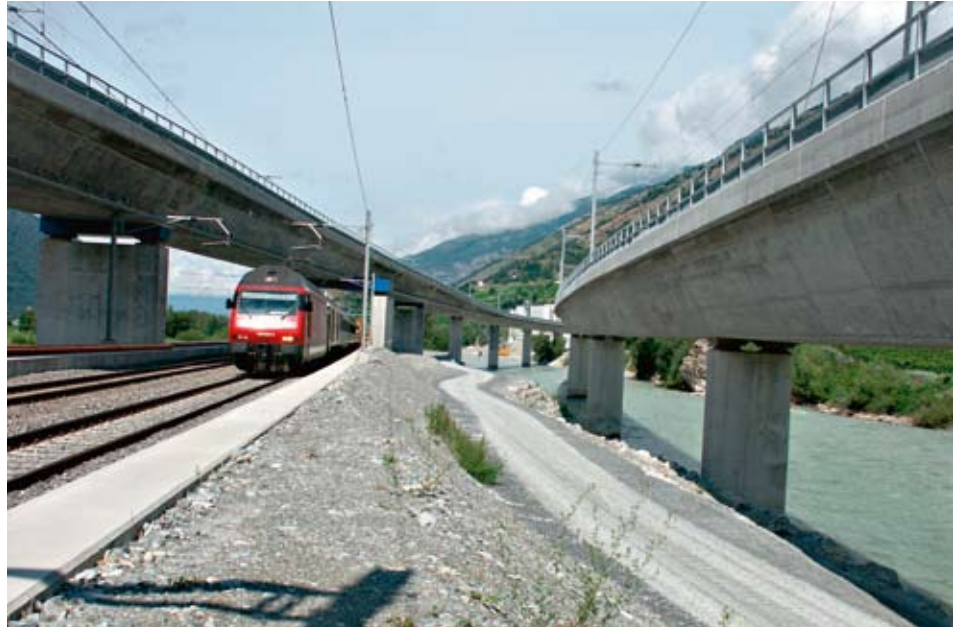
Malgré les mesures prises ces dernières années pour la route comme pour le rail, l'augmentation du trafic a provoqué un engorgement des capacités. L'Office fédéral du développement territorial prévoit une nouvelle augmentation du trafic.

Un des buts de la politique suisse des transports est de transférer le fret de la route vers le rail. Cela signifie qu'il faut développer le réseau ferroviaire et encourager le transfert vers le rail en pilotant la demande. Ces mesures rendent nécessaire la création de nouveaux sillons ferroviaires. Dans les situations de surcharge, il peut être plus efficace, économiquement parlant, d'attribuer tel sillon aux trains de marchandises plutôt qu'au transport des voyageurs. Pour atteindre efficacement le transfert recherché, on devrait donc réfléchir aux priorités en matière d'attribution des sillons.