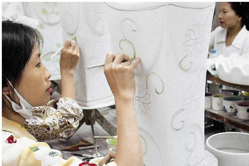
Le développement des pays prioritaires, que le Seco soutient en tant que tels, demeure manifestement fragile. Pour relever les défis encore en suspens, l'aide économique et commerciale extérieure demeure nécessaire. En illustration: fabrique de textiles au Vietnam.

Le message du Conseil fédéral sur la coopération économique au développement se caractérise par une concentration des domaines d'intervention et une réduction du nombre des pays qui bénéficient de mesures bilatérales en ce domaine. Ce redéploiement garantit l'efficacité et l'impact de l'aide apportée, et la création d'une plus-value sur le plan international. Le crédit-cadre de 800 millions de francs permettra au Secrétariat d'État à l'économie (Seco), d'une part, de poursuivre jusqu'en 2012 les activités qui s'inscrivent dans la politique économique et commerciale de la Suisse au titre de la coopération au développement et, d'autre part, d'apporter une contribution durable à la réduction de la pauvreté.