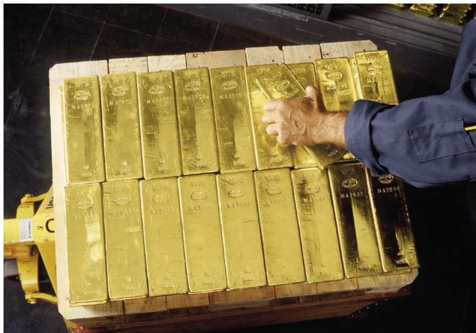
La dette brute des administrations publiques devrait se stabiliser en 2007, sous l'effet de la reprise conjoncturelle et parce que les cantons ont consacré à la réduction de leur endettement la majeure partie des recettes qui leur ont été reversées après la vente des réserves d'or excédentaires de la Banque nationale.

La Confédération, les cantons et les communes ont budgétisé un déficit global de 350 millions de francs pour 2007, ce qui constitue une nette amélioration par rapport à l'année précédente. En 2007, la Confédération prévoit, selon la statistique financière, un déficit de 102 millions de francs, contre 850 millions pour les cantons. Quant aux communes, elles s'attendent à un léger excédent de 600 millions. La dette brute des collectivités publiques devrait atteindre, cette année, un montant de 227 milliards, soit 46,7% du produit intérieur brut (PIB).