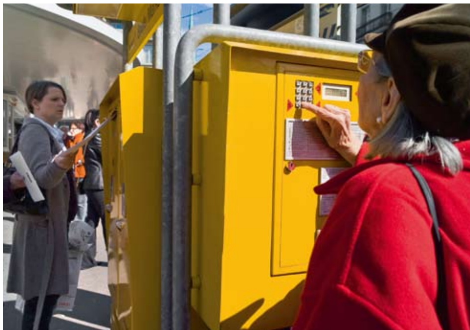
Mit der Senkung des Briefmonopols der Schweizerischen Post von 100 auf 50 Gramm sind noch immer rund 75% der Briefe vom Wettbewerb ausgeklammert. Das zögerliche Vorgehen illustriert, wie brisant das Thema der Postmarktöffnung in der Politik ist.

Mit der Liberalisierung des Postmarktes geht nicht zuletzt die Befürchtung einher, dass minimale Standards des Service public nicht mehr erbracht werden. Ein zentrales Element der vom Bundesrat vorgelegten neuen Postgesetzgebung ist daher die Beauftragung der Post mit der Grundversorgung. In der praktischen Umsetzung ergeben sich jedoch Schwierigkeiten: Definition, Umfang und die Art der Finanzierung des Auftrages beeinflussen wesentlich die Funktionsfähigkeit des Wettbewerbs.