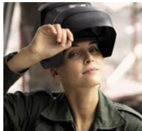
Die revidierte ASA-Richtlinie bringt vor allem bei Arbeitssicherheit und Gesundheitsschutz administrative Entlastung.

Kaum eine Wahl in Bezug auf Arbeitssicherheit und Gesundheitsschutz haben Betriebe mit besonderer Gefährdung: Hier müssen entweder Spezialisten der Arbeitssicherheit her oder die Unternehmen schliessen sich einer Branchenlösung an, was nach wie vor der effizienteste Weg ist.