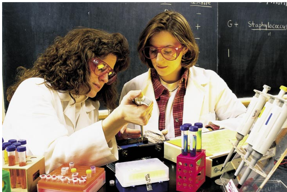
Ziel der Revision des Patentgesetzes ist es, das Innovationsklima und das Wirtschaftswachstum zu fördern und gleichzeitig einen Ausgleich zwischen den wirtschaftlichen Interessen und den gesellschaftlichen – ethischen wie sozialen – Werten zu schaffen.

Das Schweizer Patentrecht wird gegenwärtig revidiert. Die Gesetzgebung soll dem technologischen Fortschritt angepasst werden, der im Bereich der Biotechnologie besonders ausgeprägt ist. In einer Zeit, in der Einigkeit darüber herrscht, dass die Schweiz wirtschaftlich nur überleben kann, wenn sie konkurrenzfähig ist, muss unser Land auch die dazu erforderlichen Instrumente bereitstellen. Die laufende Revision bietet eine solche Chance, die nicht verspielt werden darf. Wichtig ist jedoch, dass der Patentschutz Forschung und Entwicklung (F&E) nicht blockiert, sondern fördert. Selbst wenn im Rahmen des Gesetzgebungsverfahrens zweifellos noch ein «Feinschliff» bevorsteht, ist die Vorlage zur Revision des Bundesgesetzes über die Erfindungspatente ein delikater Mittelweg zwischen den Interessen der Grosskonzerne, der kleinen und mittleren Unternehmen (KMU) und der Allgemeinheit. Auch ethischen Grundsätzen und den Interessen der Entwicklungsländer wird Rechnung getragen. 1