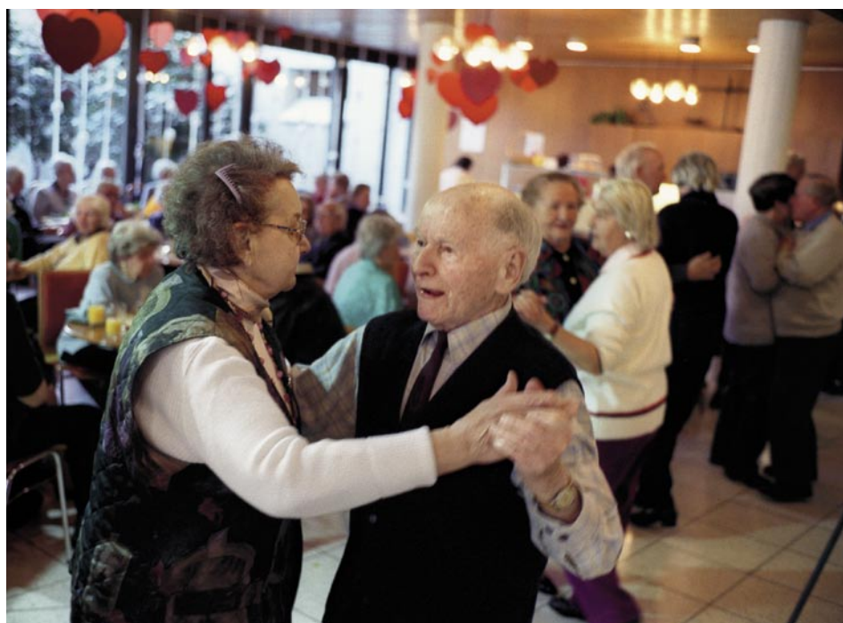
Für das Jahr 2006 budgetieren die Sozialversicherungen (AHV, IV, EO, ALV) insgesamt ein Defizit von 2,9 Mrd. Franken. Damit erhöht sich das Finanzierungsdefizit der öffentlichen Verwaltung (inkl. Sozialversicherungen) im Jahr 2006 auf 6,8 Mrd. Franken.

Die Voranschläge von Bund, Kantonen und Gemeinden für das Jahr 2006 zeigen ein Defizit in der Grössenordnung von 3,9 Mrd. Franken. Dies entspricht einer markanten Verbesserung im Vergleich zum Vorjahr. Der Bund und die Kantone veranschlagen für 2006 gemäss Finanzstatistik ein Defizit von je 1,7 Mrd. Franken. Die Gemeinden rechnen im Jahr 2006 mit einem leichten Rückgang ihres Defizits von 700 auf 500 Mio. Franken. Die Bruttoschuld der öffentlichen Hand dürfte im Jahr 2006 241 Mrd. Franken erreichen.