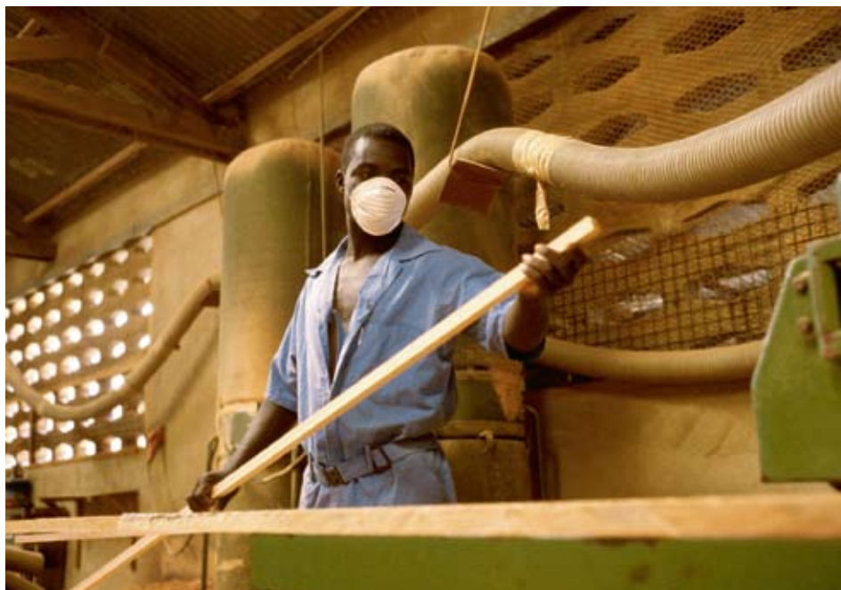
Die Initiative «Aid for Trade» unterstützt arme Länder, aus dem Handel einen grösseren Nutzen für ihre Entwicklung zu ziehen. Sie ist als Ergänzung zu anderen Formen der Entwicklungszusammenarbeit – und nicht als Konkurrenz – konzipiert. Im Bild: ein tansanisches Unternehmen, das mit Unterstützung des Seco zertifiziertes Holz exportiert.

Die Öffnung der Märkte ist für den Export der Entwicklungsländer eine grosse Chance. Doch eine plötzliche Liberalisierung – beispielsweise im Anschluss an eine Verhandlungsrunde – erweist sich unter Umständen als Schock für die wirtschaftlich schwächsten Länder. Im Rahmen der Verhandlungen der Doha-Runde weisen verschiedene Anzeichen darauf hin, dass die Entwicklungsländer beträchtliche Anpassungskosten tragen müssen, die sich auf rund 1,5 Mrd. US-Dollar pro Jahr belaufen werden. Bei der Finanzierung dieser Anpassungskosten spielt auch die wirtschaftliche Entwicklungszusammenarbeit eine bedeutende Rolle. Der freie Zugang zu den internationalen Märkten ist lediglich eine Vorbedingung zur besseren Integration der Entwicklungsländer in den Welthandel.